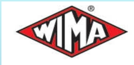
メタライズドフィルム